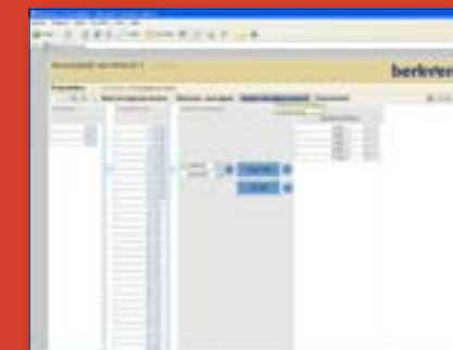
UBS website, koppelen van woningtype en bouwnummer