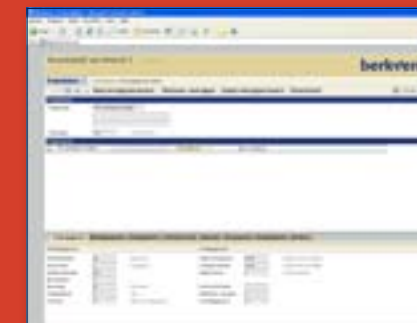
UBS website, projectbeheer